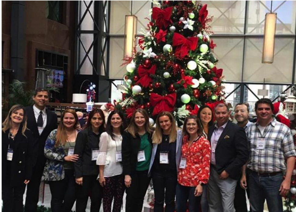
Primeira reunião da Comissão Diretiva do SLEPE